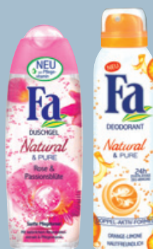
Fa Natural & Pure/ Natural & Soft

Neu zum 100. Geburtstag von Persil: Beste Ergonomie – erlaubt einfaches und sauberes Dosieren.