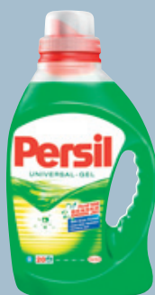
Persil Liquid „Circle Bottle“

Neu zum 100. Geburtstag von Persil: Beste Ergonomie – erlaubt einfaches und sauberes Dosieren.