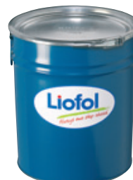
Liofol: Neue Generation von Kaschierklebstoffen