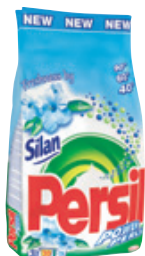
Persil mit der Frische von Silan